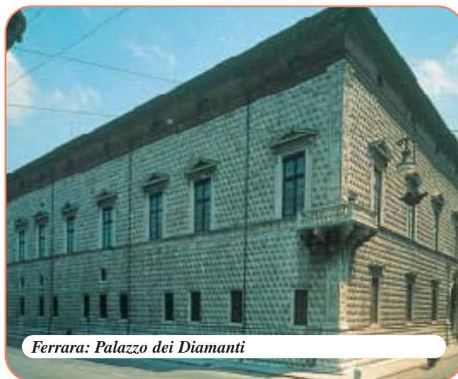
Ferrara: Palazzo dei Diamanti