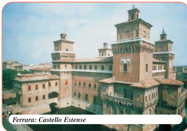
Ferrara: Castello Estense

Si consiglia di chiedere conferma degli orari di apertura dei luoghi di visita.