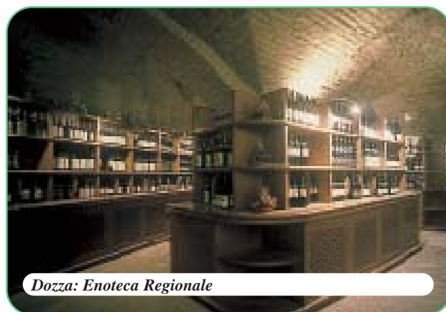
Dozza: Enoteca Regionale

Si consiglia di chiedere conferma degli orari di apertura dei luoghi di visita.