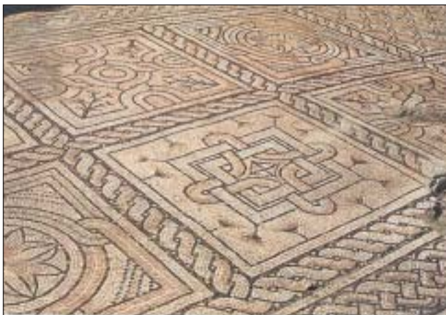
Ravenna - Mosaico pavimentale in Via D'Azeglio

Tra il 1993 e il 1994 la Soprintendenza per i Beni Archeologici dell'Emilia Romagna ha riportato alla luce un complesso di strutture edilizie databili dall'età romana repubblicana al periodo bizantino. Di particolare interesse è un palazzetto di cui sono apparsi quattordici ambienti e tre cortili. Tutte le stanze erano pavimentate in tarsia di marmo o a mosaico. I "tappeti di pietra", sono stati ricollocati nel luogo dove sono stati scoperti, al quale si accede dalla Chiesa di Sant'Eufemia in via Barbiani, previa richiesta.