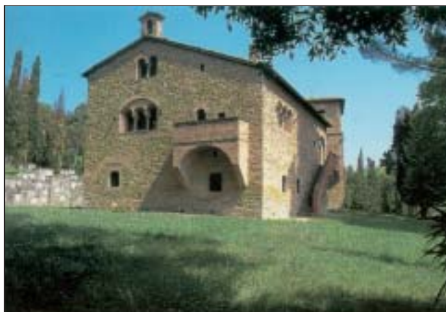
Casola Valsenio - Il Cardello