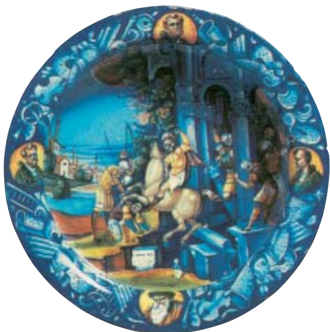
Faenza - Museo Internazionale delle Ceramiche

quota d'iscrizione, trasporto, bevande, pasti non inclusi nel trattamento, visite guidate a Faenza, Riolo Terme e Casola Valsenio, ingresso a Palazzo Milzetti a Faenza, alla Rocca di Riolo Terme, al Cardello e al Giardino delle Erbe Officinali a Casola Valsenio e tutto quanto non espressamente menzionato alla voce "La quota è comprensiva".