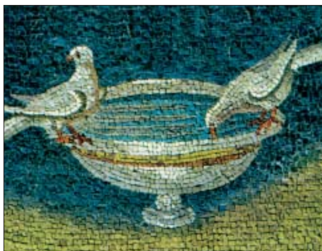
Ravenna - Mausoleo di Galla Placidia: Particolare colombe

quota d'iscrizione, trasporto, bevande, pasti non inclusi nel trattamento, visite guidate a Ravenna e tutto quanto non espressamente menzionato alla voce "La